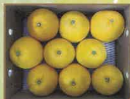
↑約3kgのイメージです